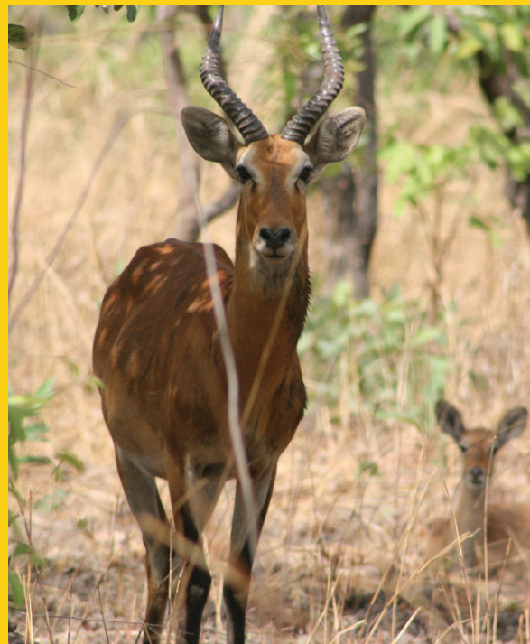
Cobe de Buffon dans le Parc de Boubandjida.