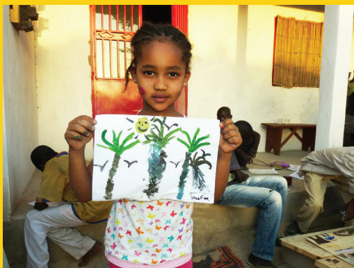
Petite fille exhibant fièrement son dessin représentant le Cameroun, son soleil et ses palmiers

L'animation commencera par la diffusion de dessins animés camerounais de Soffo Simo Jérôme : Animtest (2min), Baobab les deux jeunes gens (14min), Nul n'est censé ignorer la loi (5min). L'artiste Marthe Bolda animera ensuite des ateliers de création autour du Cameroun, entre lignes et couleurs.